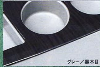
◎カラーは純正近似色の2色を用意!