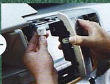
↑グローブボックスを開けると工具を差し込む溝が2カ所あるので、そこに工具の先端を入れてセンターパネルを外す。同時にカブラーも2箇所外す ◎センターパネルを外す