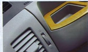
純正インパネまわりと同様にシボ模様を採用。また、ウッドカラーだけでなくコンソール部も純正カラーと同色のグレースジュで統一。