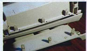
上部の純正コンソールと同様に、取り付けのツメまで忠実に再現。抜群のフィット感と装着感を味わうことができる。