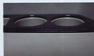
50 エスティマの純正ウッドカラーに合わせて、黄木目と黒木目を用意。純正インパネに馴染むスマートな仕上がりが。